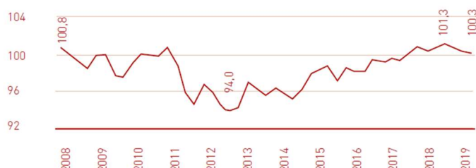
Bouwbarometer Vlaamse KMO's: evolutie 2008-2019